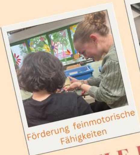
Förderung feinmotorische Fähigkeiten