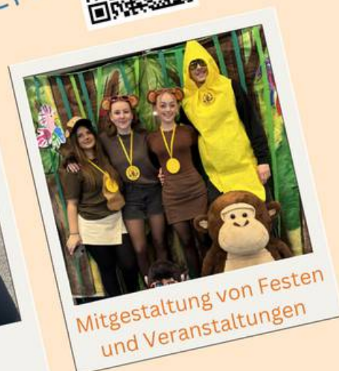
Mitgestaltung von Festen und Veranstaltungen