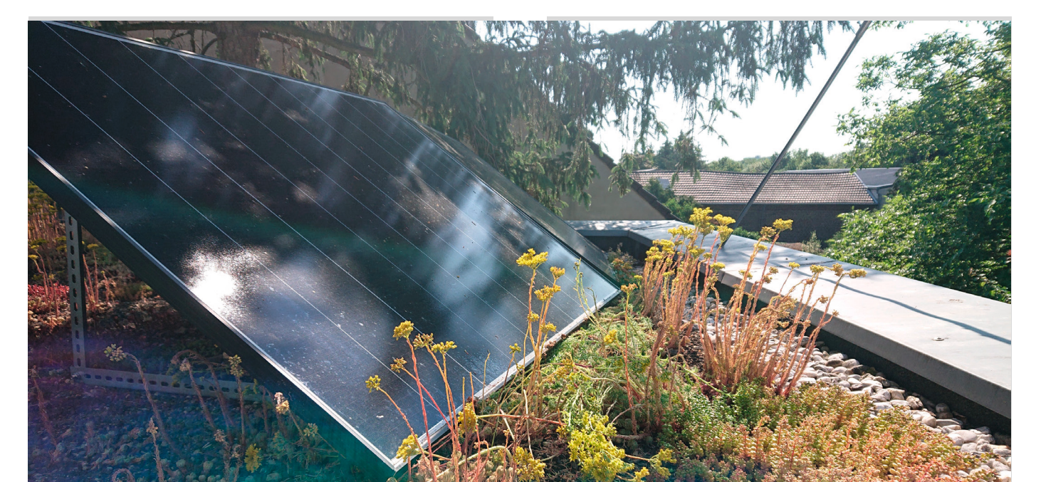
Urheber: Ilona Komossa, Stadt Solingen