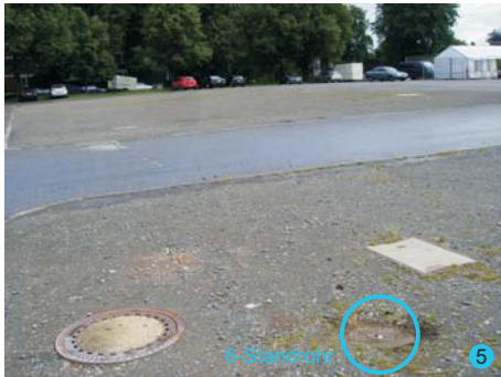
5+6: Hydranten Schützen, Anschluss Standrohre (Vermietung & Abrechnung Schützen)