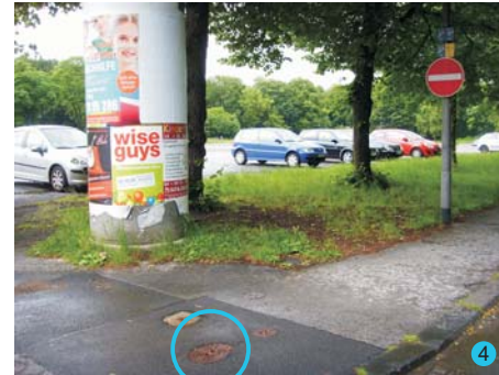
4+7: Hydranten privat, KEIN Trinkwasser, Anschluss Standrohre