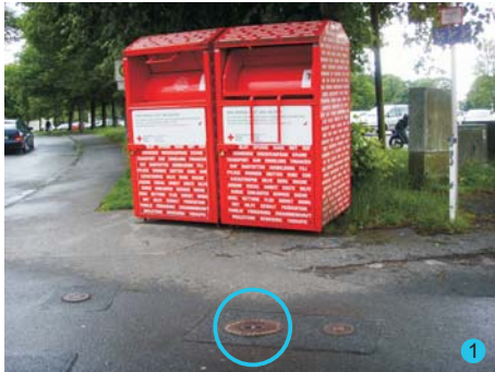
1-3: Hydranten EWR GmbH, Anschluss Standrohre (Vermietung & Abrechnung EWR)