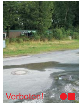
Regenwasserdeckel, Sinkkasten, Straßenabsperrentil