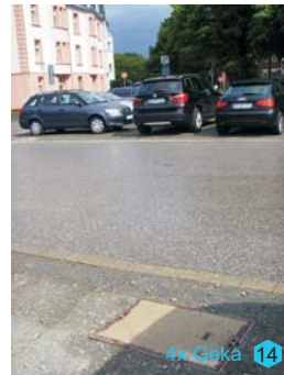
13+14: Bodenschacht Schützenverein, Anschluss: Geka-Kupplungen